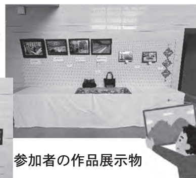
参加者の作品展示物