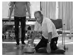
夏まつりカーリング