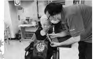
カラオケ大会優勝！