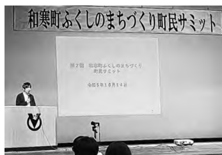
大原理事長から経過報告