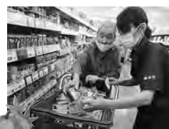
お買い物ツアーで