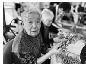
枝豆もぎのお手伝い