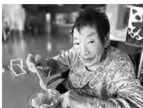
かき氷はじめました？