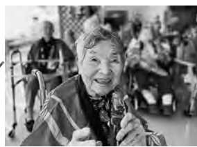
今年はかなりちっちゃな夏祭り