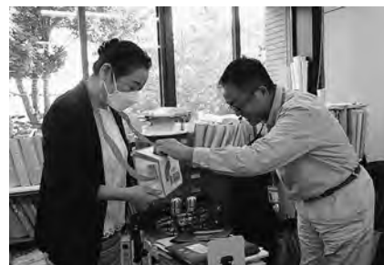
各事業所にて募金活動を行いました。