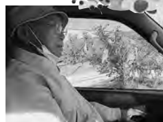
紅葉バスハイキング