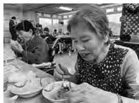
「いもだんご」うちのイモ？