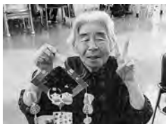
七夕飾りできました