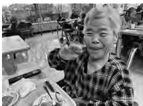
かぼちゃだんご3枚目！