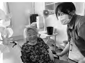
動きだし介護技術研修会