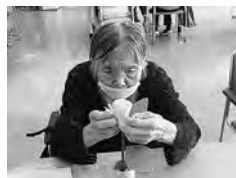
今年の文化祭は健楽苑菊花展！