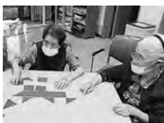
お手製のパズルゲーム