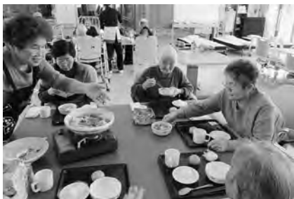
冬はお鍋が一番。 おかわり、たくさんして下さい。