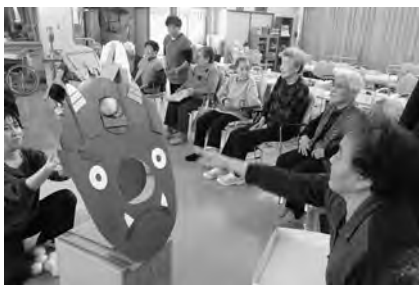
職員手作りの赤鬼・青鬼目掛けて 福は内! 鬼は外!