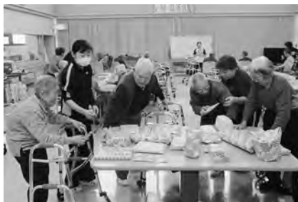
ビンゴ大会! どの景品にしようかな。