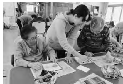
ひな祭りが近づいたので お内裏様とお雛様を作りました。