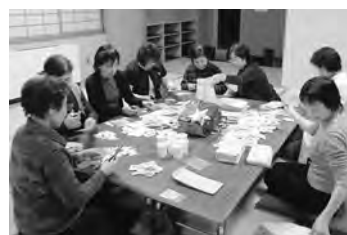
ボランティアクラブによる 切手の整理

24年度一年間、町民の皆さまから届けられた使用済み切手・書き損じはがきをそれぞれ必要としている支援団体へ送付しました。今後も皆さまのご協力をお願いいたします。