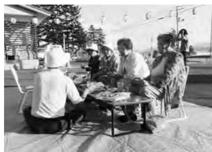
松岡・北原自治会