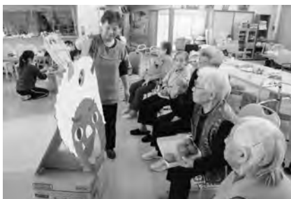
ボールくぐりゲーム。 うまく、入りましたよ。