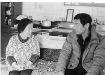
三和・菊野自治会