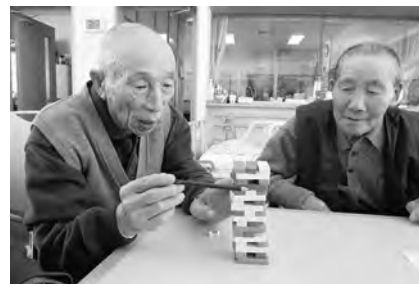
気の合う仲間とゲームに夢中! 真剣なまなざしです。